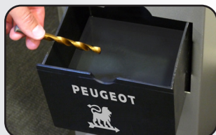
Tiroir à liquide Drawer for liquid