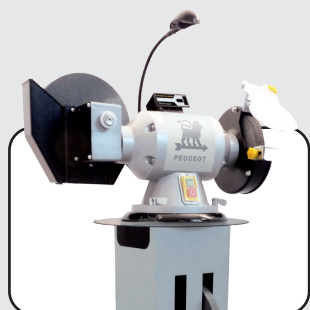
Exemple de montage de touret Bench grinder mounting example