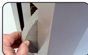
Range meules intégré Wheels holder