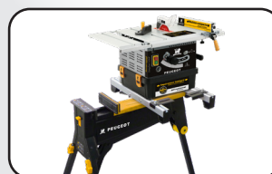
Support de scie de table Table saw stand