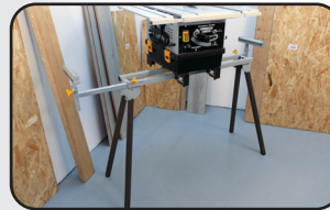
Support de scie de table Table saw stand