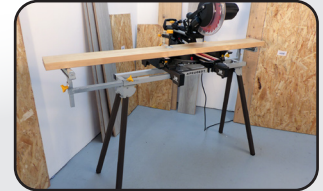
Support de scie à onglet Mitre saw stand