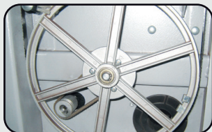
Volants en fonte d'aluminium (200 mm) Wheels in cast aluminium (200 mm)