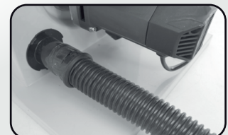
Aspiration des poussières Dust suction