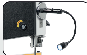
Éclairage par LED magnétique orientable Adjustable magnetic LED light