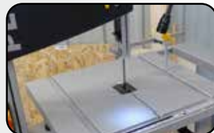
Table en fonte d'aluminium Cast aluminium table