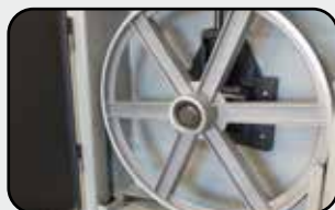
2 Volants fonte d'aluminium 305 mm 2x 305 mm cast aluminium wheels