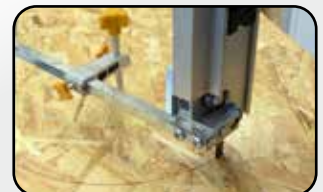
Guide de coupe circulaire Circular cutting guide