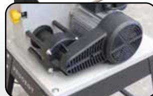
Système d'aspiration cyclonique intégré Dust wizard inside