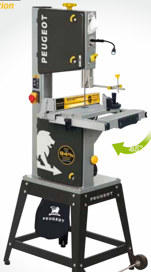
Table XXL XXL Table

Guide de coupe circulaire Circular cutting guide