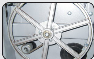
2 Volants fonte d'aluminium 250 mm 2x 250 mm cast aluminium wheels