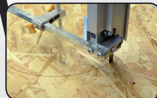
Guide de coupe circulaire Circular cutting guide