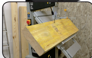
Table inclinable 45° Tilting table 45°