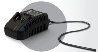
Livrée avec chargeur Charger included

DESIGNED IN FRANCE BY PEUGEOT DESIGN LAB