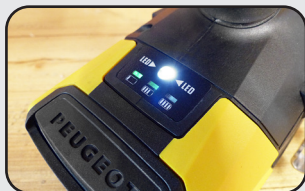
Éclairage LED de la zone de travail LED light of the working area