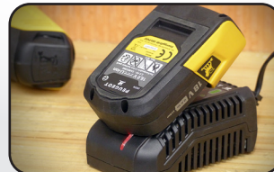
Chargeur rapide : temps de charge 90 min Fast charger : charging time 90 min