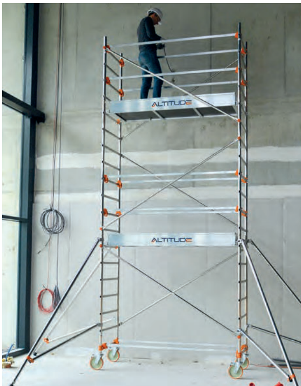
AL205 version standard Hauteur travail 5.90 m