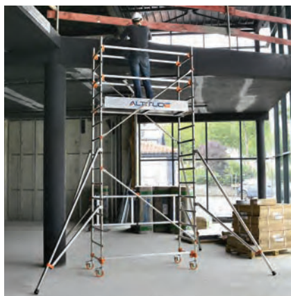
AL165 version base pliante Hauteur travail 4.80 m