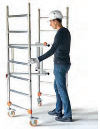
Installation express de la base pliante