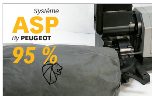
Système d'aspiration intégré avec sac de récupération Integrated dust collector system with collection bag