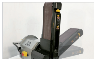
Bras inclinable de 0 à 90° 0 to 90° sanding belt tilt adjustment